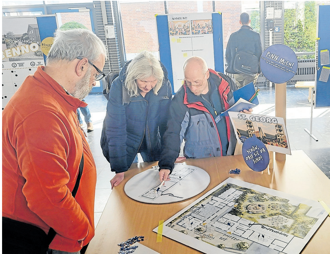
Was braucht ein Begegnungszentrum in Jürgenohl und wo soll es hin?