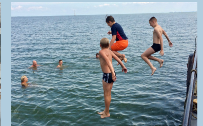
Badespaß vom Bord

Es gibt zwar neben den Toiletten und Waschbecken auch zwei Duschen an Bord, doch da wir nur einen begrenzten Trinkwasservorrat haben, wird üblicherweise nicht an Bord geduscht. In jedem Hafen gibt es ein Duschhaus, wo man für ca. 1-2 € gemütlich duschen kann. (Kleingeld mitbringen!)