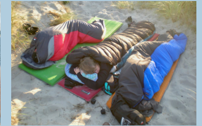
Schlafen in den Dünen

Es hat sich als praktisch erwiesen, dass es mittags einen Imbiss gibt und am Abend (im Hafen oder im Watt) die Hauptmahlzeit. Die Aufgaben wie Kochen und Spülen, Einkauf und Reinigung werden wir uns auf dem Schiff in täglich wechselnden Gruppen aufteilen.