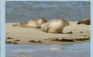
Seehunde am "Wegesrand"